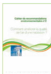
Cahier n°2 Comment améliorer la qualité de l'air d'une habitation ?