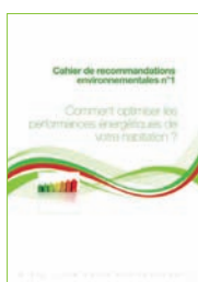
Cahier n°1 Comment optimiser les performances énergétiques de votre habitation ?

Retrouvez-les sur www.agglo-valdebievre.fr