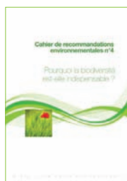
Cahier n°4 Pourquoi la biodiversité est-elle indispensable ?