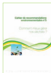
Cahier n°5 Comment mieux gérer nos déchets ?

Cahiers réalisés en collaboration avec l'Agence de l'énergie Val-de-Marne Vitry