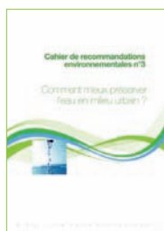
Cahier n°3 Comment mieux préserver l'eau en milieu urbain ?